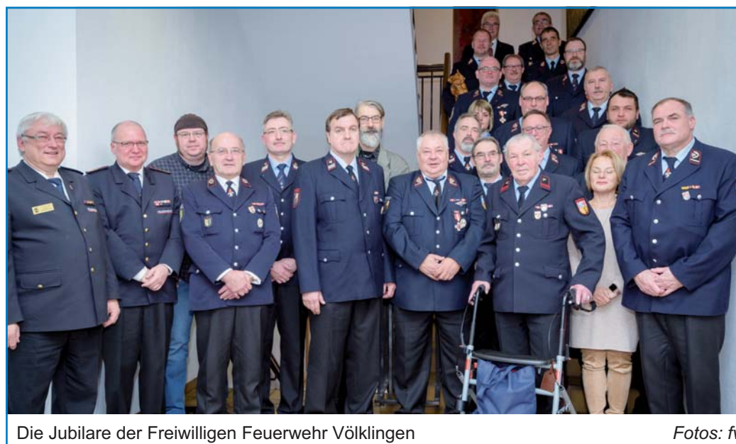
Die Jubilare der Freiwilligen Feuerwehr Völklingen