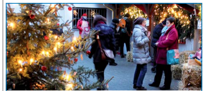
Weihnachtsstimmung im Innenhof des Hauses der Diakonie

Am 9. Dezember veranstaltete das BIWAQ-Projekt „Besser leben und arbeiten im Quartier“ einen kleinen Weihnachtsmarkt im Innenhof des Hauses der Diakonie in der Gatterstraße. Weihnachtlich geschmückte Holzhäuser und ein prächtiger Weihnachtsbaum zauberten vorweihnachtliche Stimmung ins Quartier „Nördliche Innenstadt“. Bei klirrendem kaltem Winterwetter genossen die Besucher herrlich warmen, gewürzten Winterpunsch und konnten dem mittelalterlichen Barden bei seinen Liedern lauschen. Es herrschte eine gelöste Atmosphäre und es wurden traditionelle Tänze aufgeführt. Auch für das leibliche Wohl im Quartier wurde gesorgt. Wer noch auf der Suche nach Weihnachtsgeschenken war, konnte an den beiden Kreativständen wintertliche Weihnachtsmützen, selbst gebaute Nistkästen oder liebevoll gestaltete Holzfiguren erstellen. Auch das Café Valz war geöffnet. Im mollig warmen Nebenraum lauschten Groß und Klein Frau Raphaela Leue, wie sie spannende Weihnachtsgeschichten vortrug. Der Weihnachtsmarkt im Hof stieß durchgehend auf breite Zustimmung.